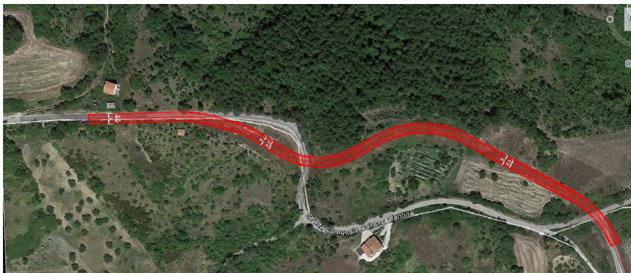
Figura 2 - Ingrandimento Tronco da realizzare

Il tratto viario che essa andrà a collegare è stato costruito intorno all'anno 2000 ed adeguato nell'anno 2006. Si Allega un ingrandimento con la rappresentazione dell'intervento: